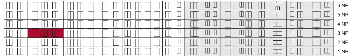
Severní pohled na dům/ Building View - North side