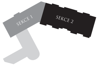
Schéma areálu | Chart campus